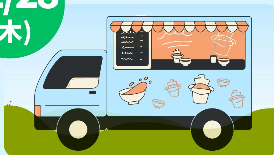
ビストロPA-PA (パスタ・日替わり弁当等)