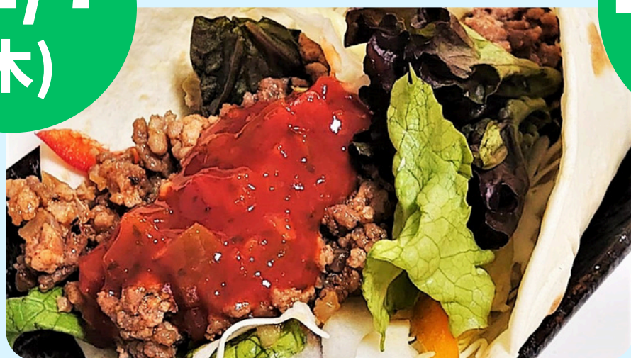
高野フードトラック仙台 (タコス・ルーローハン等)