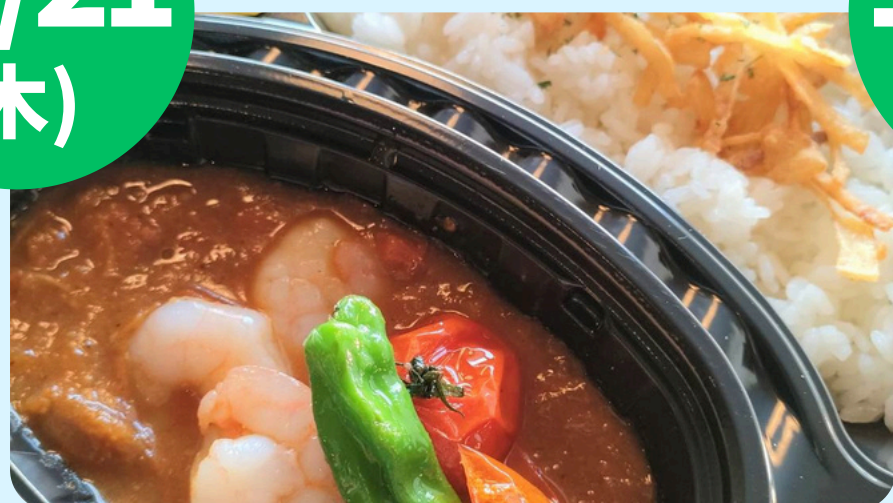
JOCA東北1号 (カレーライス・からあげ等)