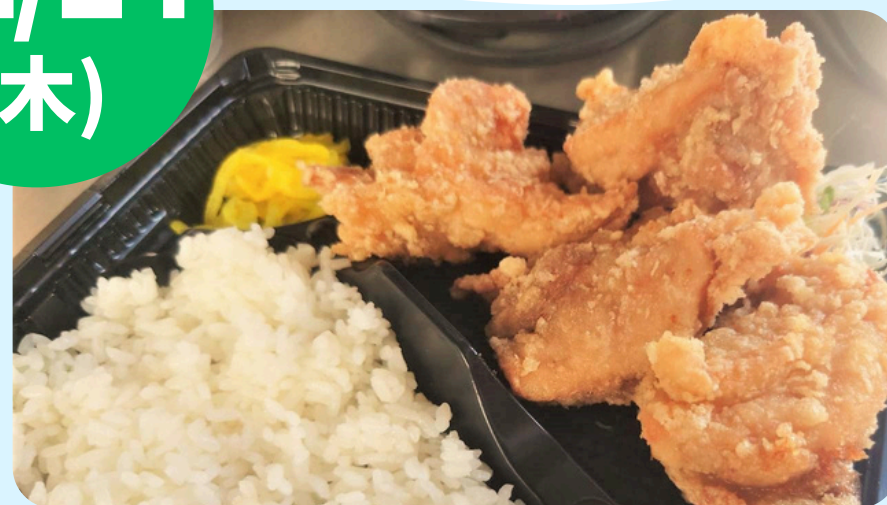
名取フードサービス (日替わり丼・ローストビーフ丼等)