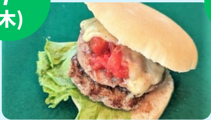
鉄パン屋 (ハンバーガー・日替わり弁当等)