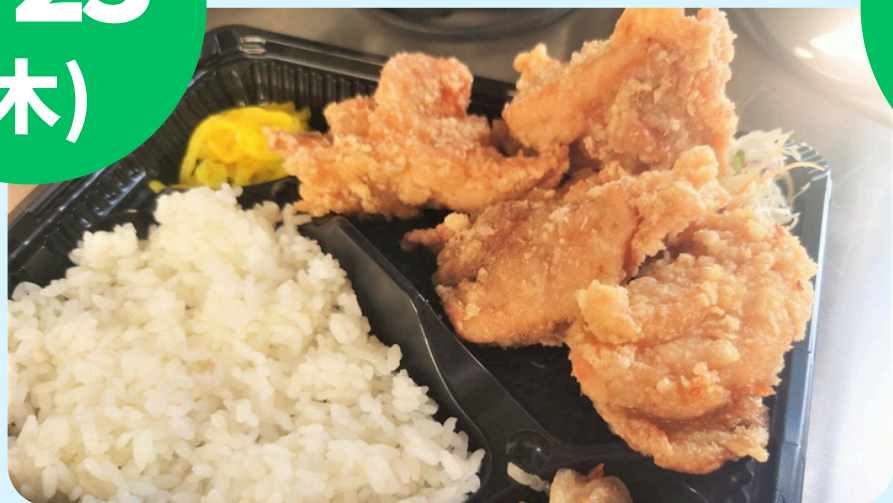
名取フードサービス (日替わり弁当・ローストビーフ丼)