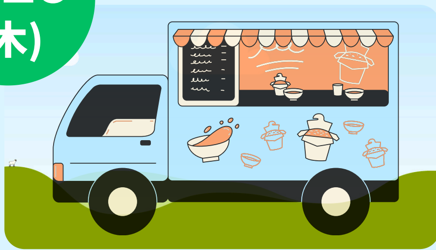
ビストロPA-PA (パスタ・日替わり弁当等)