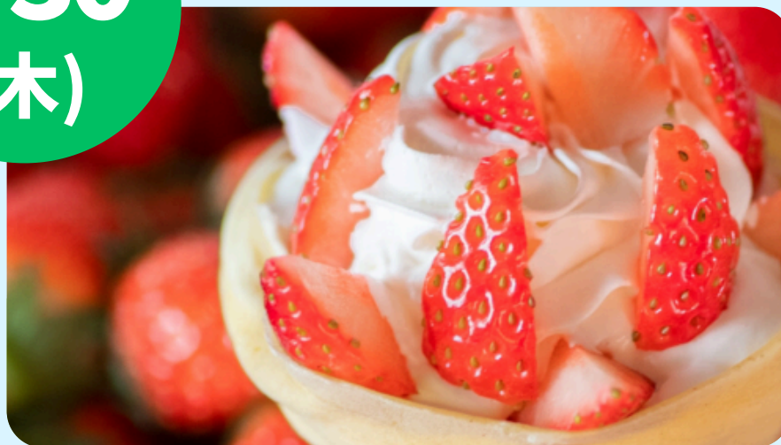
kafuu crepe (クレープ等)