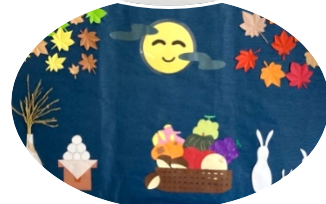
上：「クリスマス」（水曜午前） 中：「お月見」（水曜午後） 下：「秋」（木曜午前）