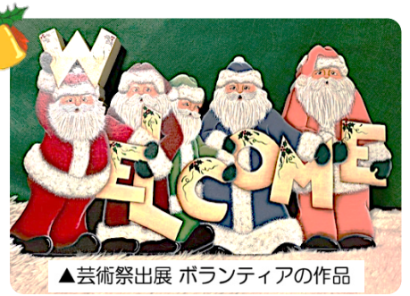
▲芸術祭出展 ボランティアの作品

宮城県仙台市青葉区落合4丁目3-17. 宮城県立こども病院 ボランティアゆりがご 広報委員会