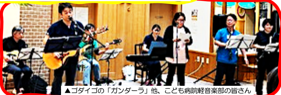
▲ゴダイゴの「ガンダーラ」他、こども病院軽音楽部の皆さん