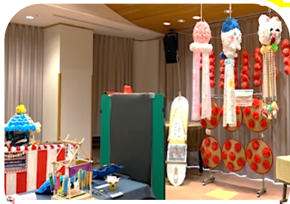
▲東北六大祭り 子どもたちの作品