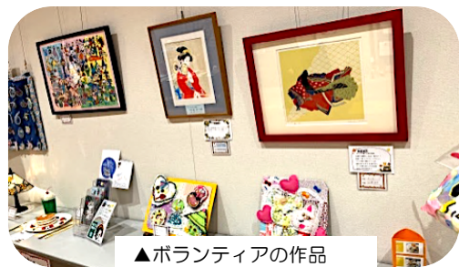
▲ボランティアの作品