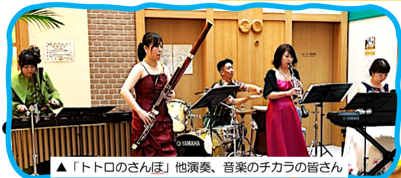
▲「トトロのさんぽ」他演奏、音楽のチカラの皆さん