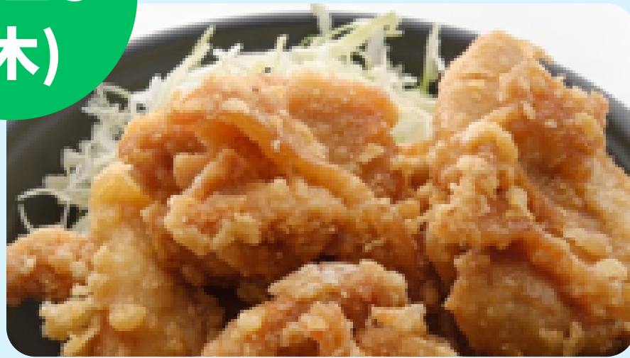
鶏吉 (唐揚げ・焼鳥弁当等)