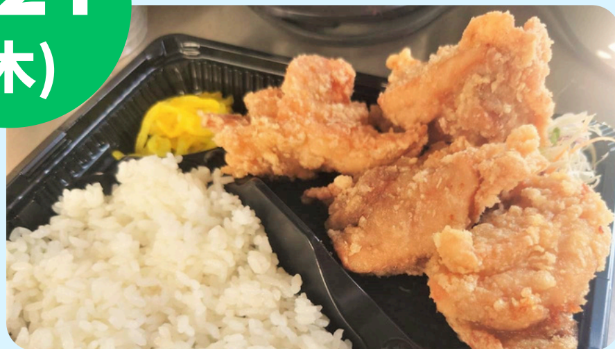
名取フードサービス (日替わり弁当・ローストビーフ丼)